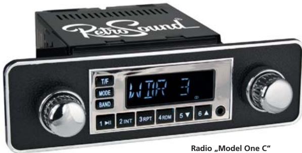
Radio „Model One C“ mit Blende RS-EUBKCT-ACRKT