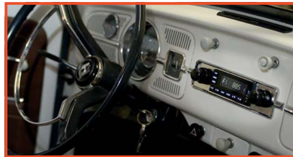
Radio „Model One B“ mit Blende RS-5867FP-CHR

Lieferbar mit über 125 verschiedene Blenden und 15 verschiedenen Metallknopf-Sets.