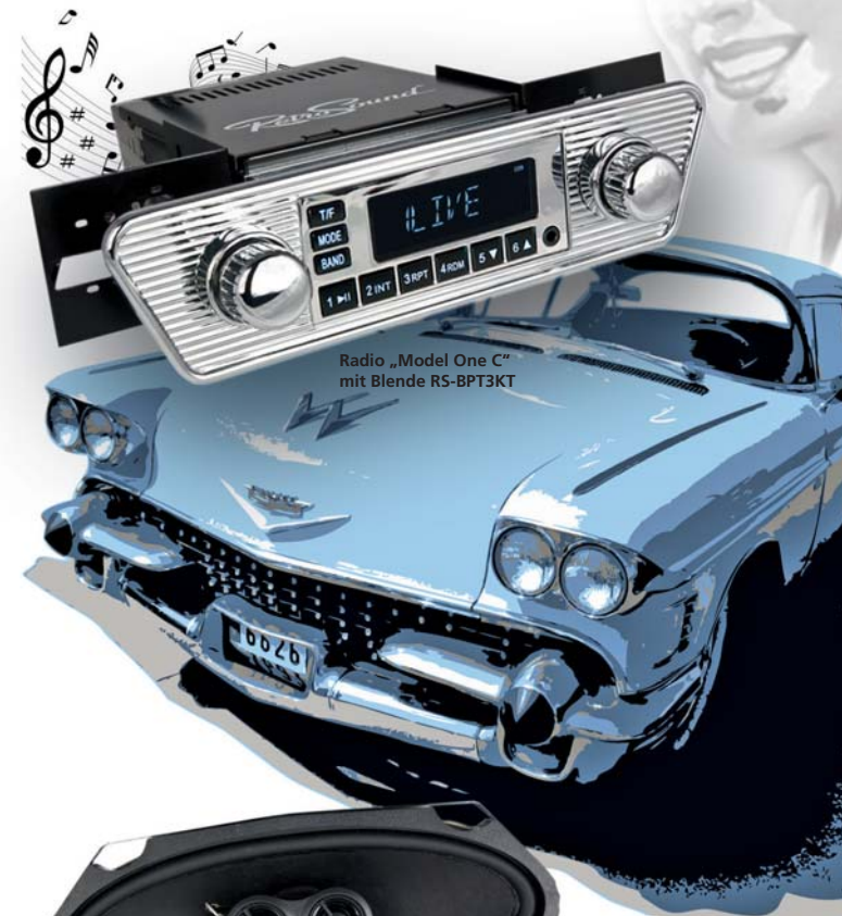
Radio „Model One C“ mit Blende RS-BPT3KT