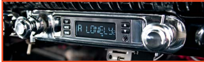
Radio „Apache“ mit Blende RS-54CHEVYTRKT