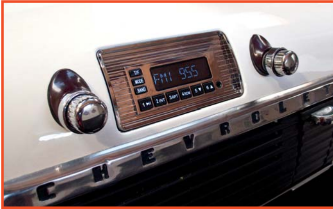
Radio „Model One C“ mit Blende RS-4753CHVYTRKT