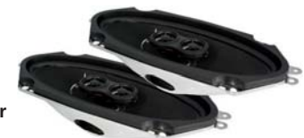
RetroMod 100 x 254mm 80 Watt pro Lautsprecher