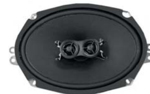
RetroMod 152 x 229mm 100 Watt @ 2-Wege Lautsprecher