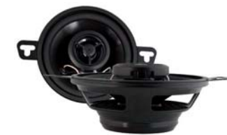
RetroMod 89mm 30 Watt @ 2-Wege Lautsprecher

Diese von Grund auf neu konzipierten Lautsprecher erfüllen die Anforderungen modernster Leistungsverstärker, passen exakt in die Lautsprecheröffnungen klassischer Autos und sind kompatibel mit allen digitalen Musikquellen.