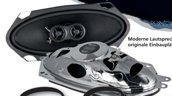
Moderne Lautsprecher für originale Einbauplätze