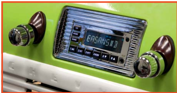
Radio „Model One C“ mit mit Blende RS-4753CHVYTRKT