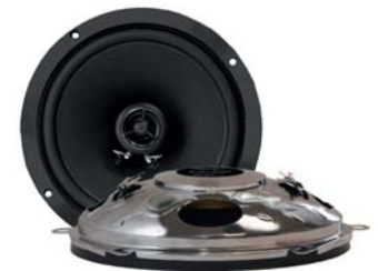
RetroMod 165mm 100 Watt @ 2-Wege Lautsprecher